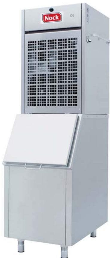
NSH 150 mit optionalem Eisvorratsbehälter NEV 100