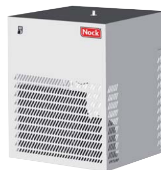
NSH 400 ohne Eisvorratsbehälter